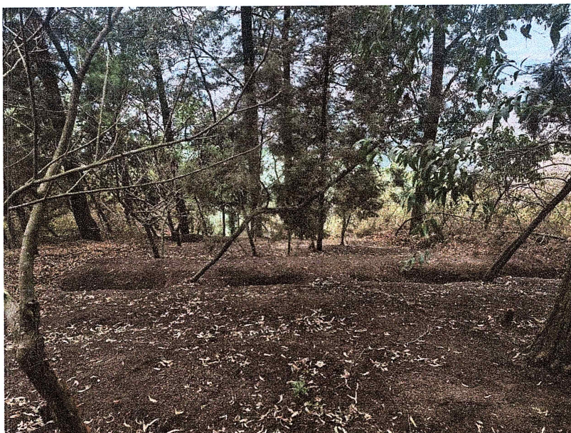
Foto 9 y 10: Estado actual de acequias en reduciendo erosión en brechas cortafuego