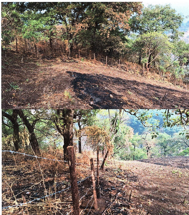
Fotos 4 y 5: Cerco instalado en límite problemático con agricultor.

Instalación de 130 metros de cerco en área de invasión agrícola colindante con el parque con recurrentes quemas: